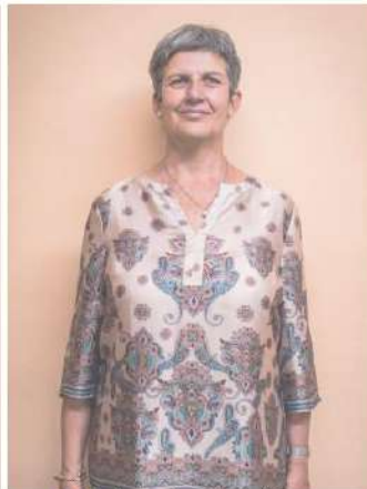
Médico de Familia

Ver perfil profesional en www.institutopna.com