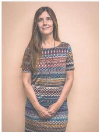
Psicóloga General Sanitaria